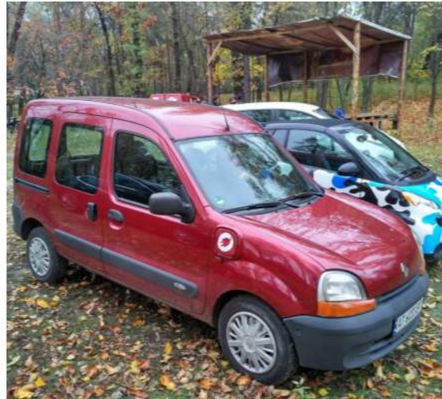
Renault Kangoo electrcite