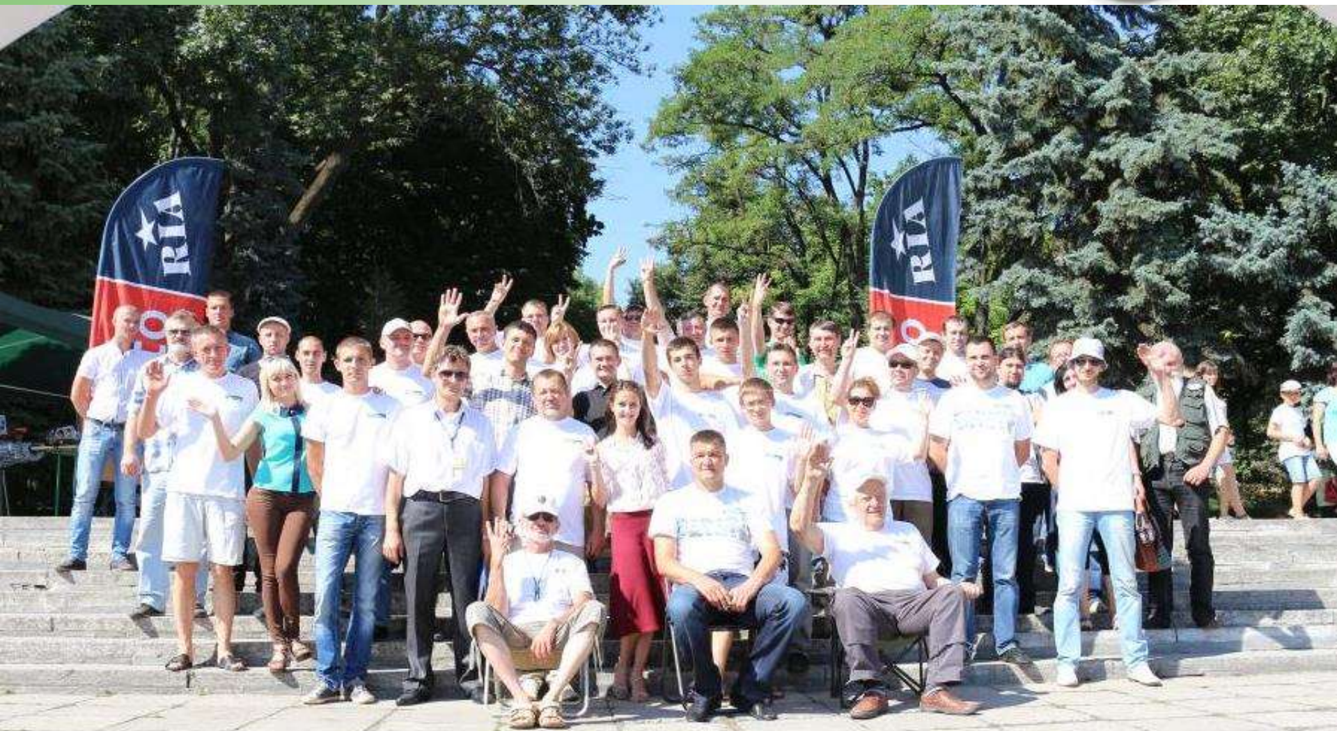
Загальне фото учасників і організаторів пробігу