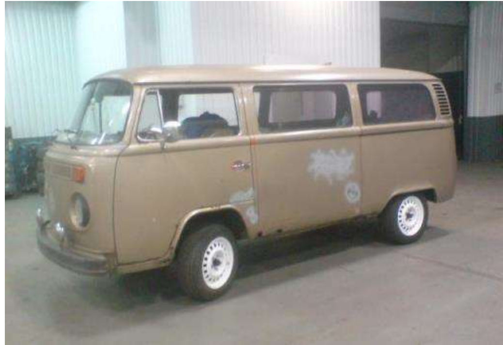
Volkswagen T2 електро