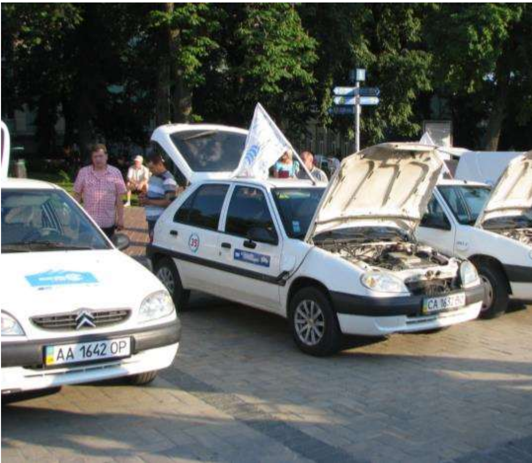
Сітроен Саксо ЕВ