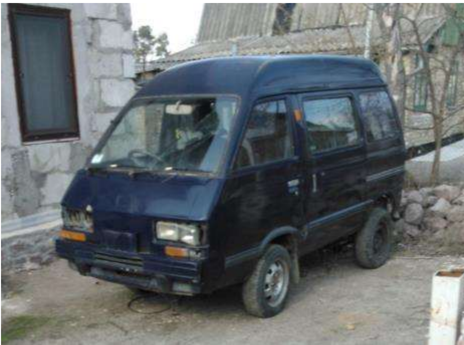
Електромінібусик Subaru libero