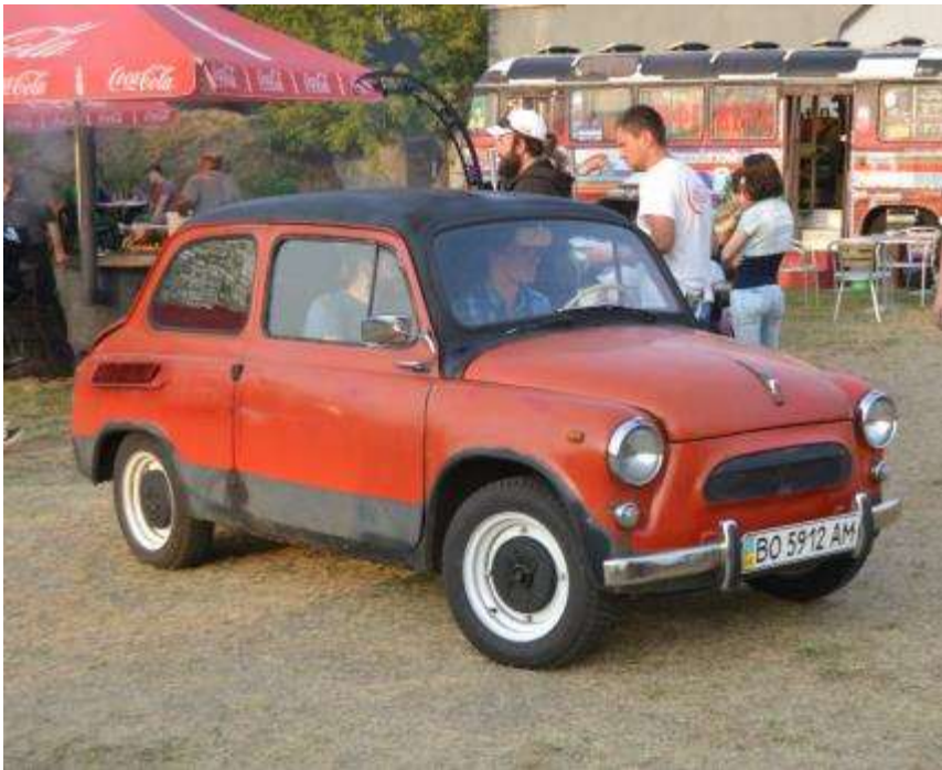
ЗАЗ 965 електро