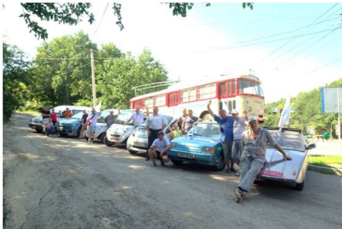
МЫ В ПОЛНОМ СОСТАВЕ ПОЗАДИ ПАМЯТНИК ТРОЛЛЕЙБУСУ (ЕМУ 40 ЛЕТ И ЗА ЭТО ВРЕМЯ ОН ПОДВЁЗ 2 МЛН. ЧЕЛОВЕК)