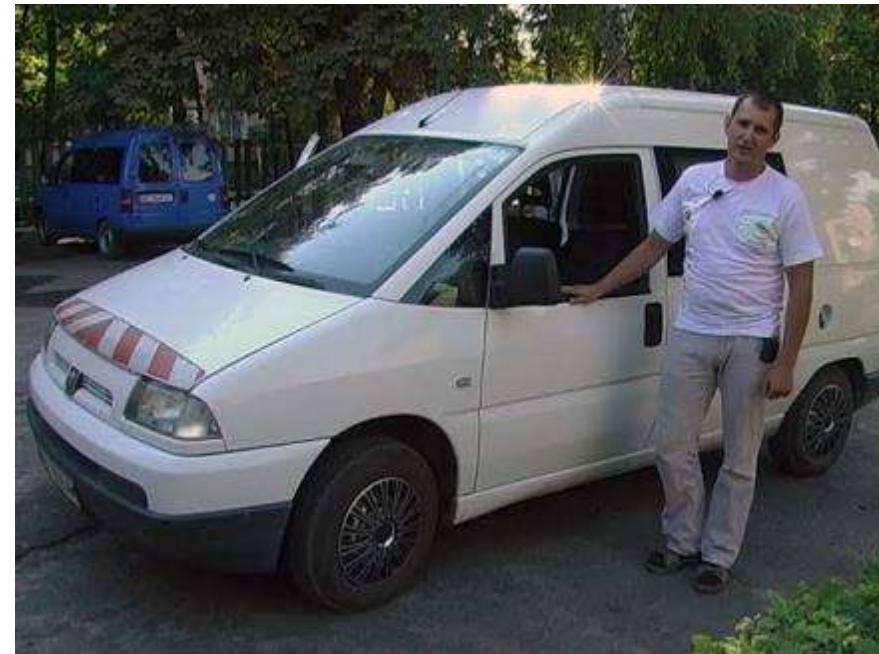
Пежо Експерт електро