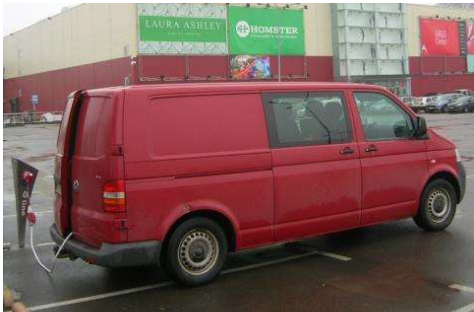
W. T5 комбі-привід