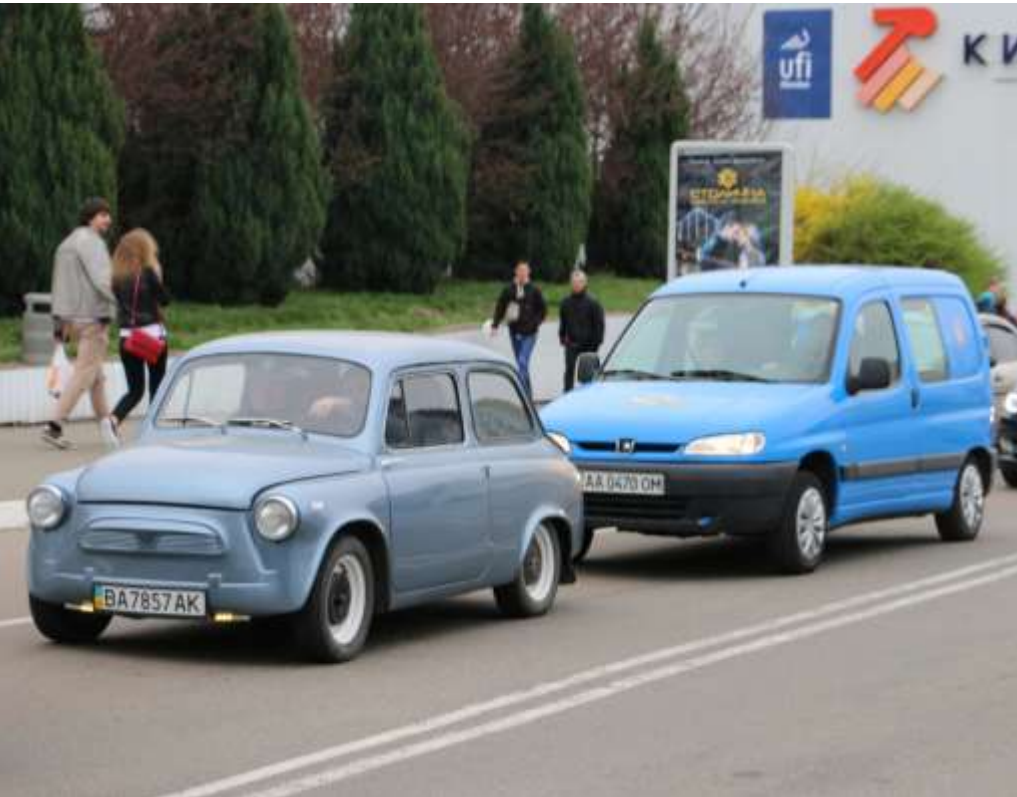
ЗАЗ електро; Peugeot Partner електро