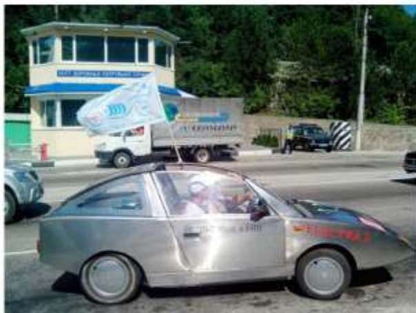
ГАИшники обомлели увидев «Электру-2»